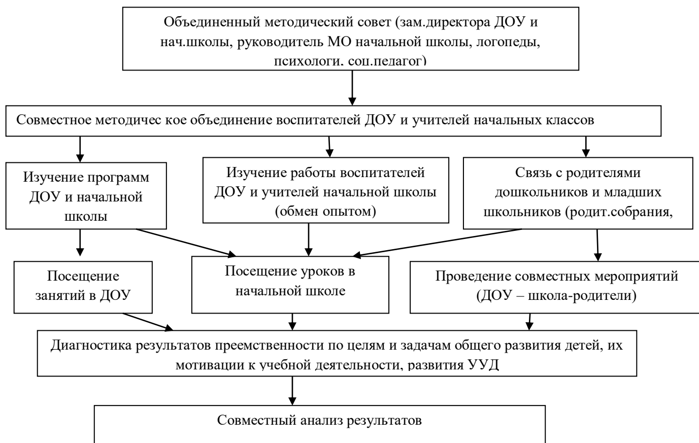
Схема совместных мероприятий учителей начальных классов с воспитателями ДОУ, учителями предметниками ОУ

Сформированность универсальных учебных действий у обучающихся при получении начального общего образования должна быть определена на этапе завершения обучения в начальной школе.